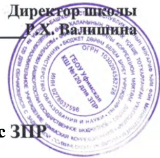
График работы столовой ГБОУ Уфимская КШ №120 для обучающихся с ЗПР на 2020-2021 учебный год